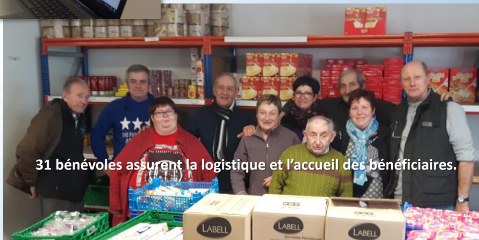
31 bénévoles assurent la logistique et l'accueil des bénéficiaires.

Cette association est née en 1987 à Saint-Chamond.